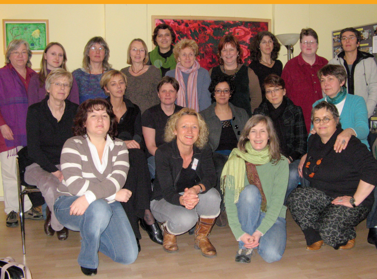
Mitarbeiterinnen der im Netzwerk zusammengeschlossenen Einrichtungen

Das Netzwerk setzt sich seit seiner Gründung für Maßnahmen zur Verbesserung der Situation betroffener Frauen und Mädchen ein.